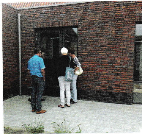
adviezen bij vooroplevering