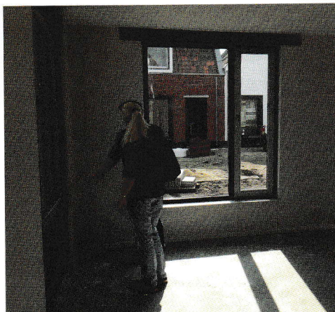
adviezen draairichting deuren en ramen.